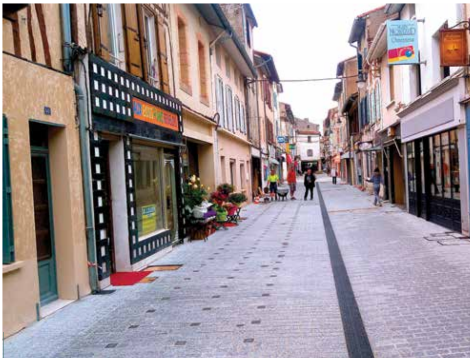
Les pavés en granit du Sidobre s'étirent jusque dans les rues annexes, sans décroché altimétrique.