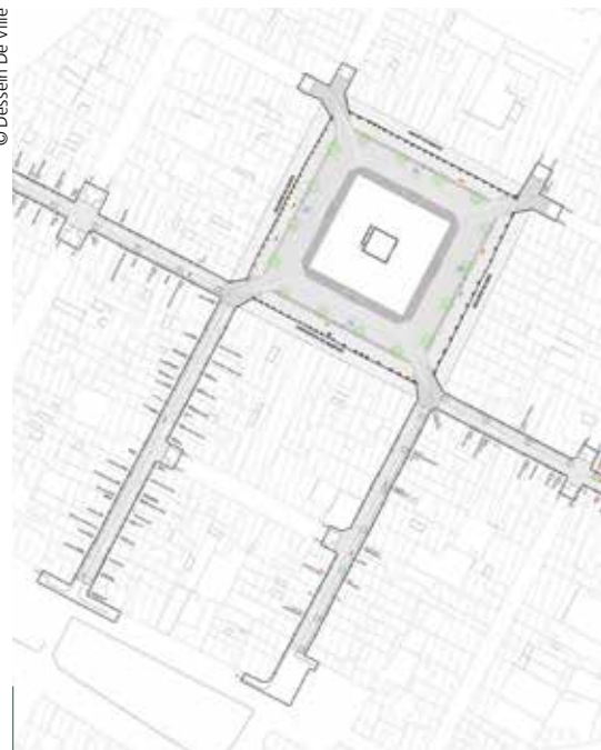
Le périmètre opérationnel du projet inclut la place centrale Philippe VI de Valois, pointée par la bastide, et quatre rues adjacentes.